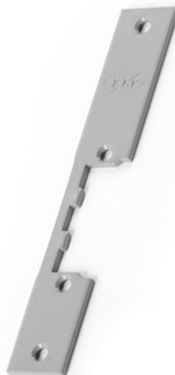
Wymiary i zdjęcie