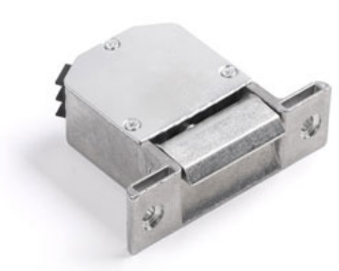
Wymiary i zdjęcie zaczeput